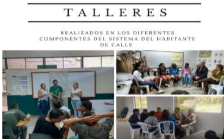
Ilustración 2. Talleres realizados en los componentes y granjas comunitarias somos gente 1y 2.

Nota: Fuente propia. Talleres realizados en los componentes y granjas comunitarias somos gente 1 y 2 (02 de octubre de 2017).