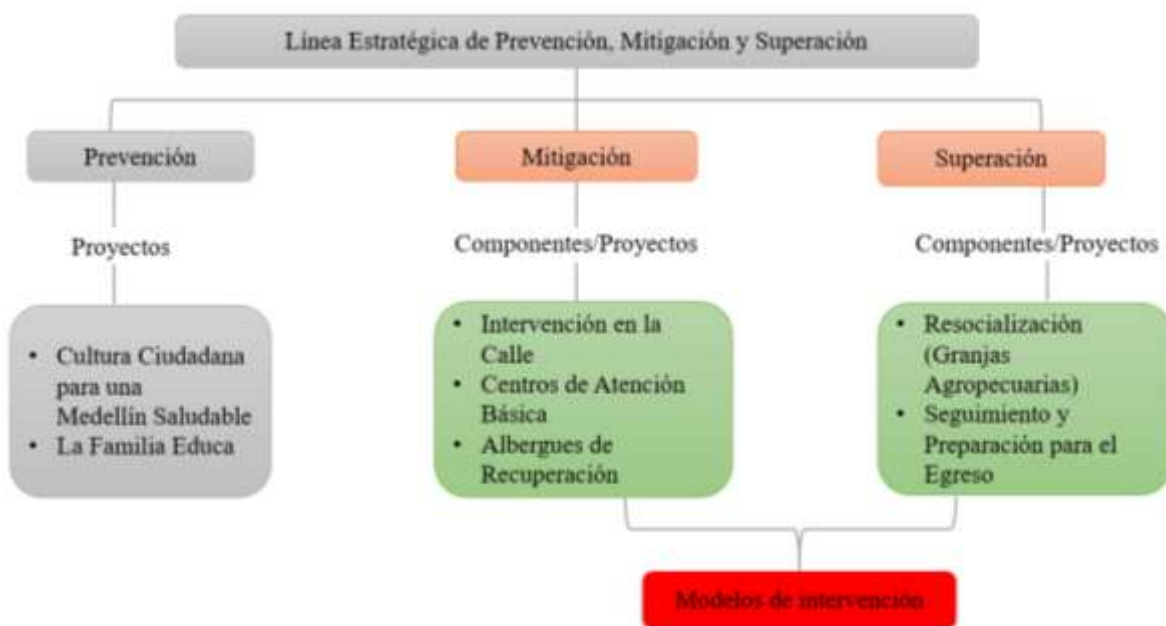
Ilustración 4. Modelos de intervención de la Política Pública

Nota: Estructura general de la Política Pública. (2018).