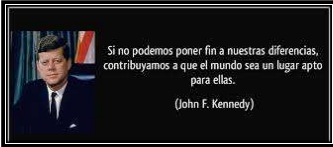
John F. Kennedy Político Estadounidense (1917-1963)