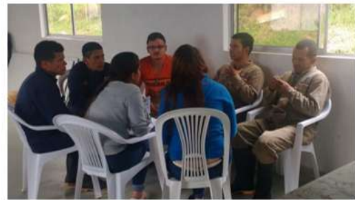
Nota: Fuente propia, talleres grupales, Resocialización, (09 de octubre de 2017).