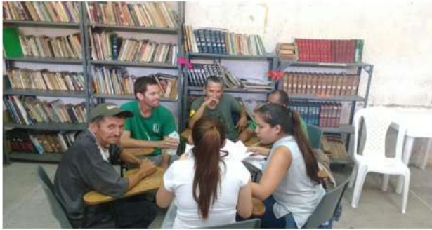
Ilustración 9. Centros de Atención Básica