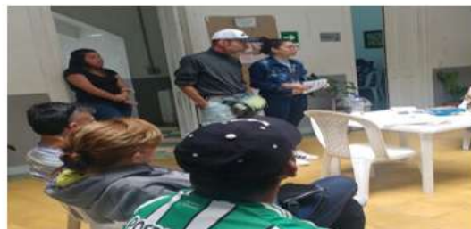
Nota: Fuente propia, talleres grupales, Egreso productivo (30 de octubre de 2017).