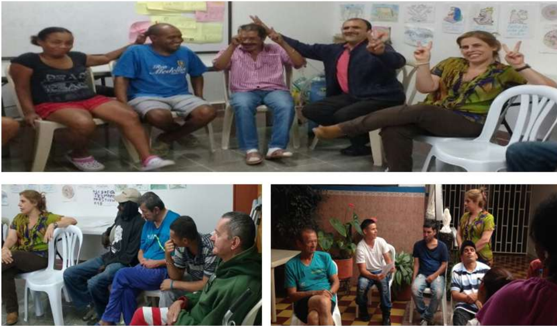
Ilustración 10. Albergues de Recuperación

Nota: Fuente propia, talleres grupales, Albergues de Recuperación, (02 de octubre de 2017).