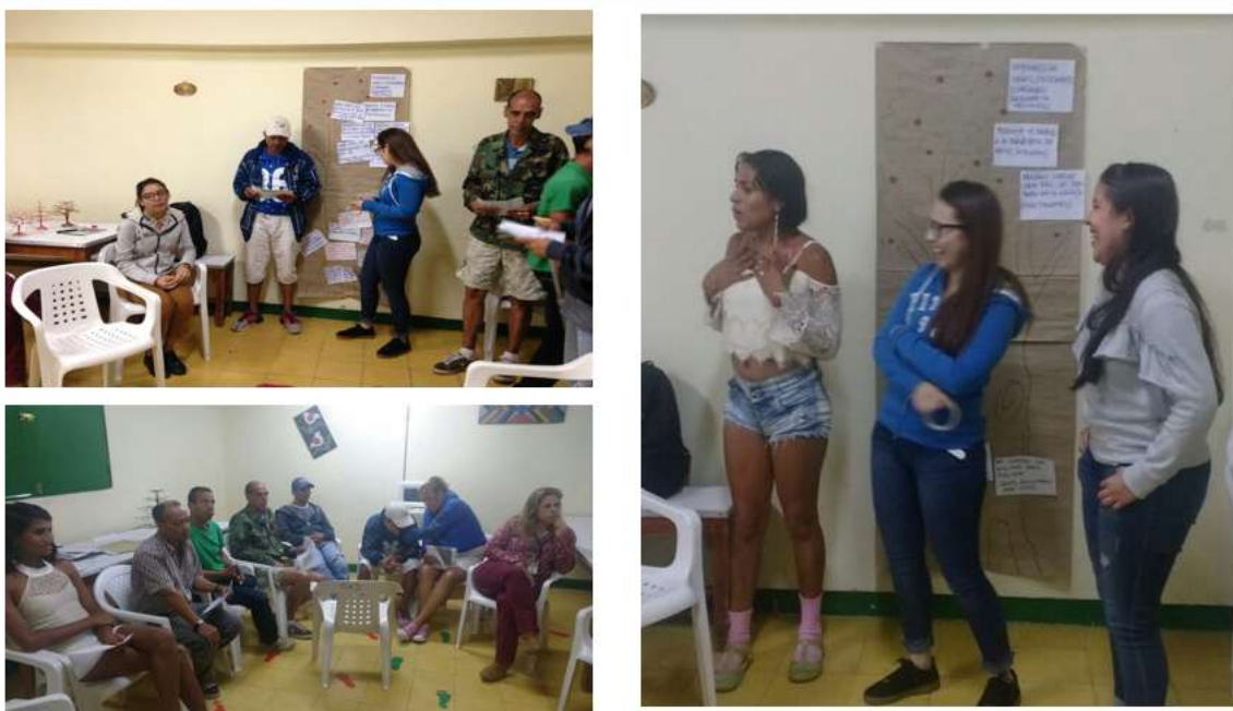
Ilustración 11. Resocialización, Granjas Agropecuarias y Egreso Productivo