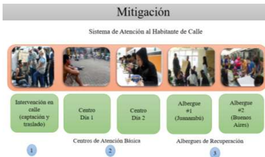
Ilustración 4. Sistema de atención al habitante de calle (Mitigación)

Nota: Fuente propia. Sistema de atención al habitante de calle, Mitigación. (2018)