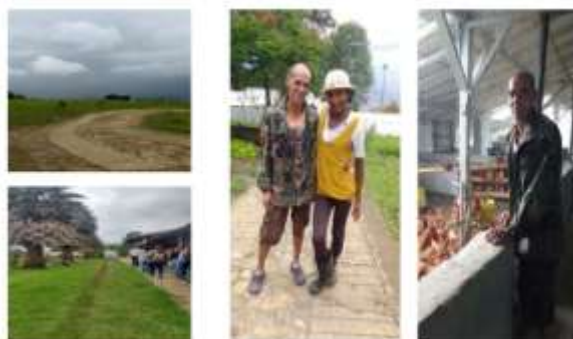
Ilustración 8. Pasantía Sistema de atención

Nota: Fuente propia. Recorrido del territorio (08 de septiembre de 2017).