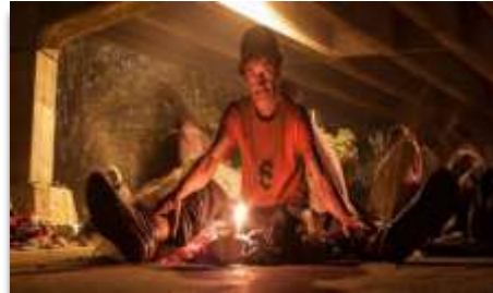
Ilustración 7. Grupo agua paneleros en las calles de Medellín

Nota: Maki Waylluna, Mano Amiga. Grupo agua paneleros en las calles de Medellín. (2017)