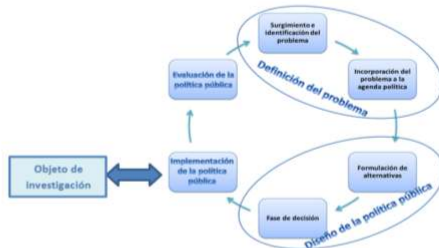
Ilustración 1. El ciclo de las políticas públicas

Nota: Catalá, D. (2015). Evaluación integral, las políticas públicas y su ciclo.