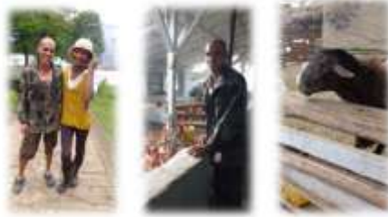
Ilustración 5. Granja agropecuaria somos gente 2

Nota: Fuente propia. Visita granja productiva somos gente 2, (08 de septiembre de 2017).