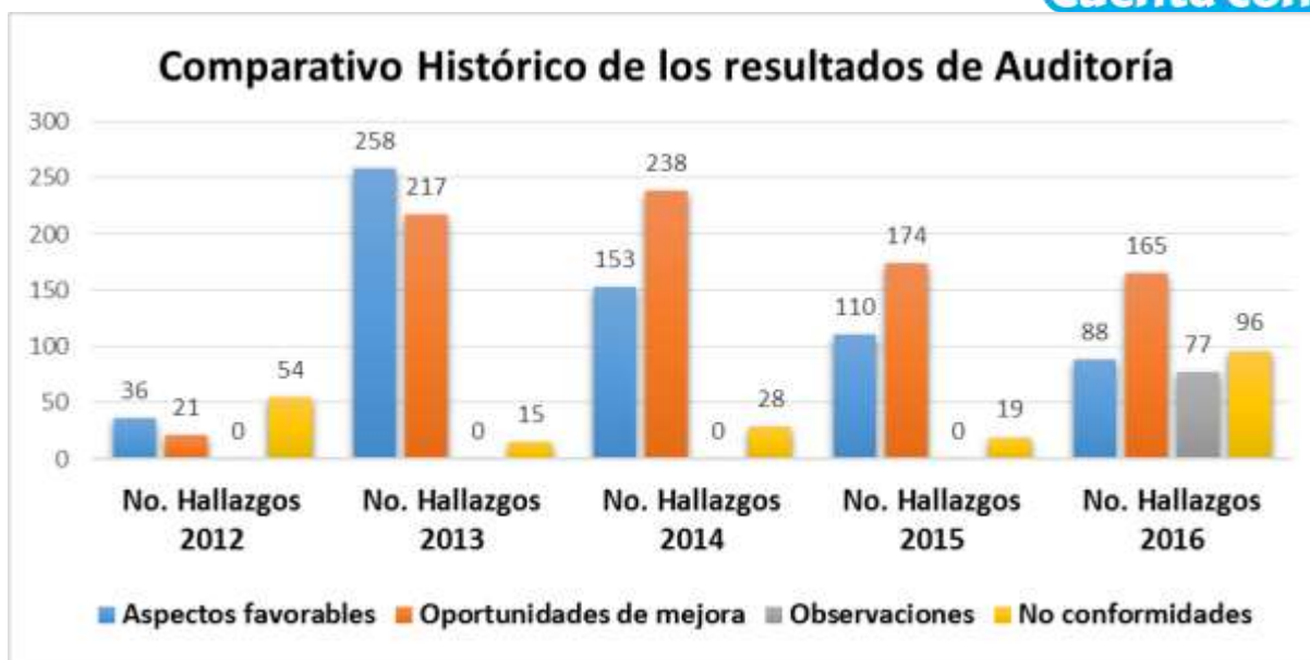
Ilustración 7: Comportamiento histórico de los resultados de la auditoría