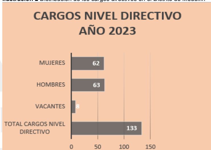
Ilustración 2 Distribución de los cargos directivos en el Distrito de Medellín

Al verificar la base de datos de los cargos de nivel directivo así como la información ingresada al aplicativo, se observó que el Distrito Especial de Ciencia, Tecnología e Innovación de Medellín contaba a la fecha de corte (30 de Septiembre de 2023) con un total de ciento treinta y tres (133) cargos del Nivel Directivo de los cuales sesenta y tres (63) son ocupados por hombres, sesenta y dos (62) por mujeres y se observan ocho (8) vacantes.