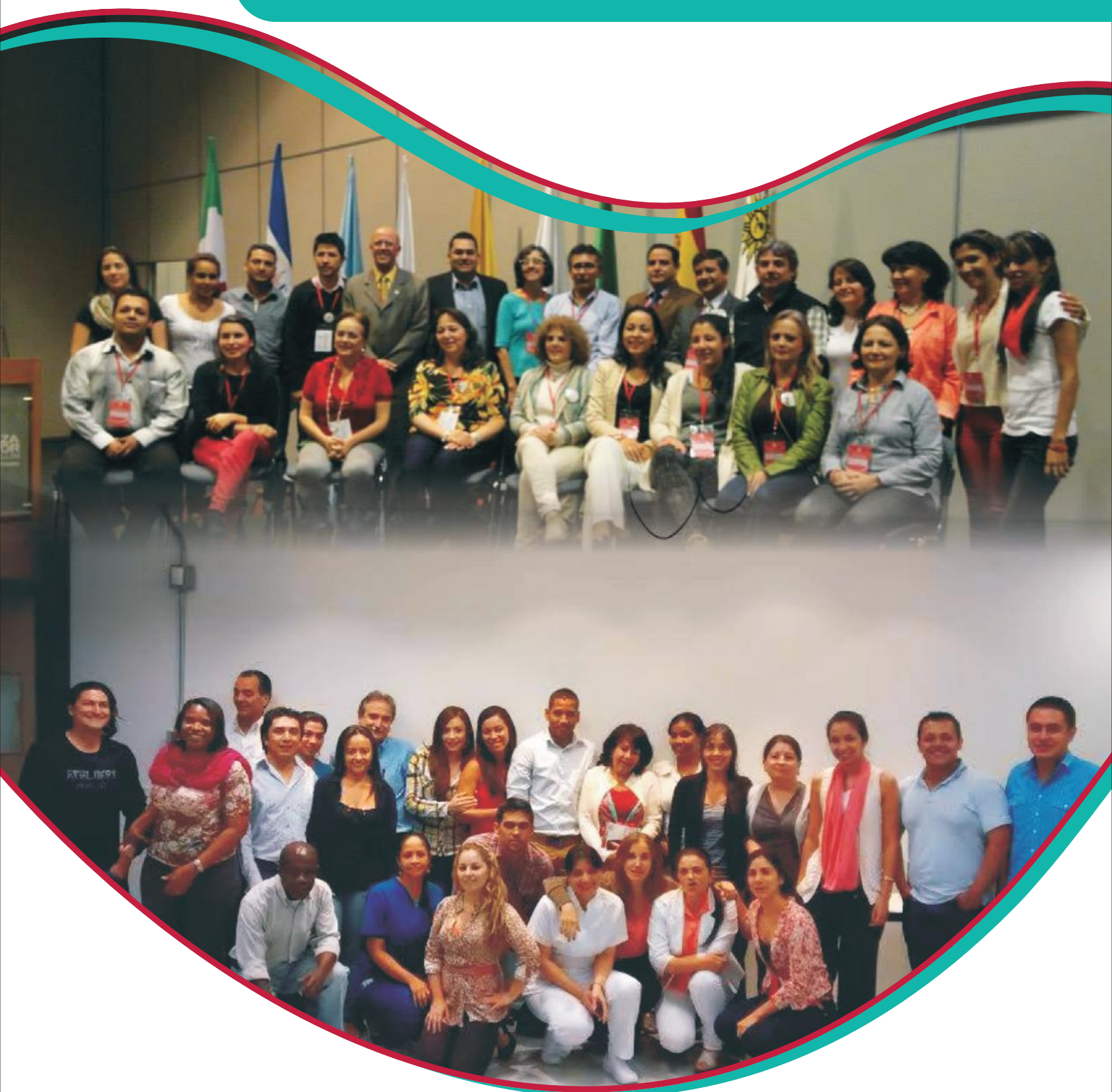
Arriba: Espacios del seminario Internacional "Políticas públicas en salud bucal, para la garantía del derecho a la salud". Abajo: Grupo de estudiantes Diplomado de Políticas Públicas en salud bucal para Medellín.