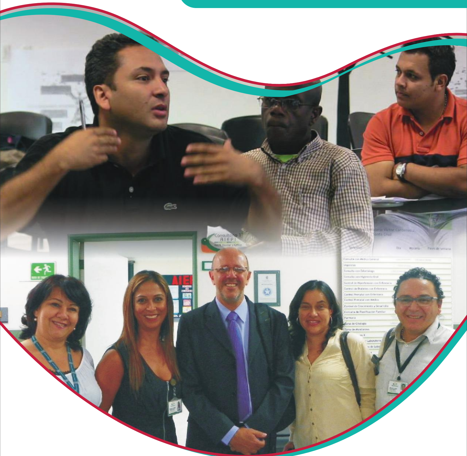
Intercambio internacional con coordinador nacional de la política de salud bucal de Brasil, visita a la ESE Metrosalud.