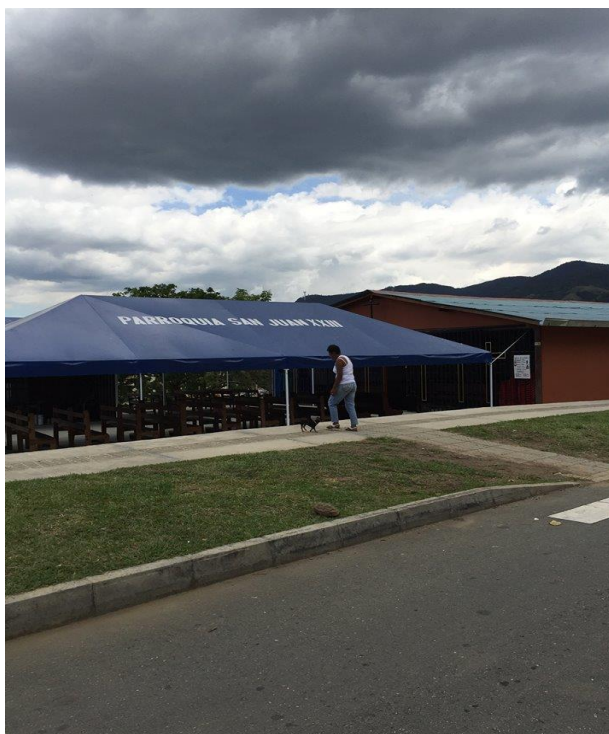
Pie de foto: Primera etapa de la Parroquia San Juan XXIII, Ciudadela Nuevo Occidente.

Con estos indicios, en esta propuesta es necesario aprovechar el respeto que la comunidad tiene hacia los líderes religiosos, para ponerlos al servicio de la resolución de los conflictos en la Ciudadela Nuevo Occidente, y que éstos trabajen de manera articulada con los Líderes Sociales y Familiares.