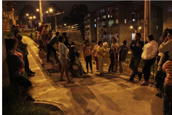
Pie de foto: Los actos violentos son acciones que han generado zozobra en CNO.

especial, los datos entregados desde la Comisaria de Familia (para conocer mejor el proceso metodológico que aquí se anuncia, remitirse al primer capítulo del presente trabajo).