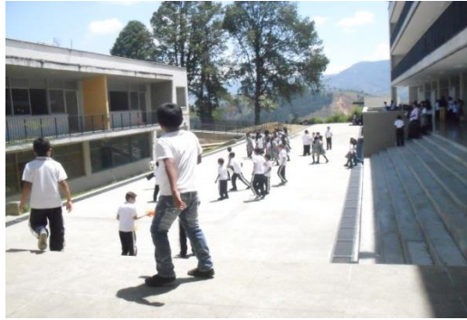
Foto: Interior de la Institución Educativa Ciudadela Nueva Occidente

Si bien uno de los hallazgos de los talleres participativos realizados tanto con jóvenes como con adultos, fue que el primer público supo diferenciar con mayor facilidad el concepto de conflicto al de violencia, aún no está totalmente clara dicha diferencia para los menores.