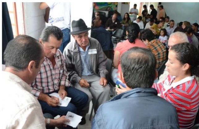
Pie de foto: Elecciones de Juntas de Acción Comunal

De otro lado, de manera simultánea y sin saber lo que proponían los jóvenes, en el taller participativo con adultos se llegó a una conclusión por parte de ellos: “...para resolución de conflictos surgió el compromiso de los líderes para ser mediadores dentro del conflicto, entre sus vecinos, y solicitan apoyo de la Administración y acompañamiento de las autoridades...” 68 .