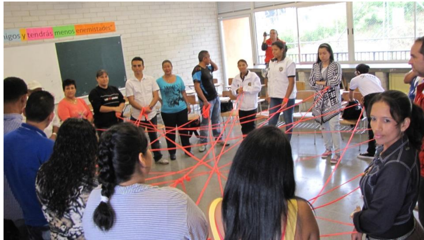
Pie de foto: Talleres participativos con líderes de la Ciudadela

habitacional, lo cual facilitó la comprensión del asunto desde diversas miradas y de manera global.