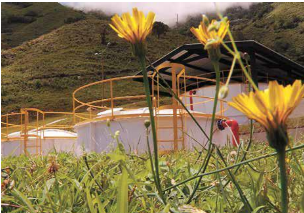
Foto Multiveredal La China de: Cuentas Claras N°1 Corregimiento 50 - San Sebastián de Palmitas julio, agosto y septiembre de 2013

Para el año 2013 se inaugura el acueducto multiveredal La China el más grande de Colombia según la rendición de cuentas claras del municipio de Medellín julio, agosto y septiembre de 2013, donde además se expresa que “El acueducto, que beneficia a los residentes de las veredas La Frisola, La Suiza y La Sucia, sector El Morrón, y que contó con una inversión por parte de la Alcaldía de Medellín de más de $9.200 millones, suministra agua potable a 210 familias campesinas del corregimiento”. Si bien este proyecto, liderado por el programa Agua Potable y Saneamiento Básico, que lidera la Secretaría de Calidad y Servicio a la Ciudadanía, tuvo gran importancia por la dedicación de los líderes del sector quienes se dieron a la tarea de continuar en la lucha por este servicio y derecho fundamental.