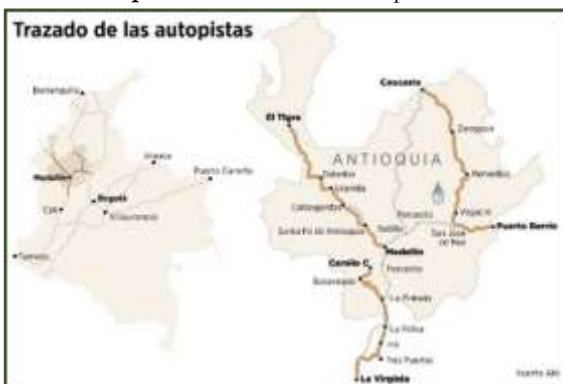
Mapa 2: Trazado de las autopistas